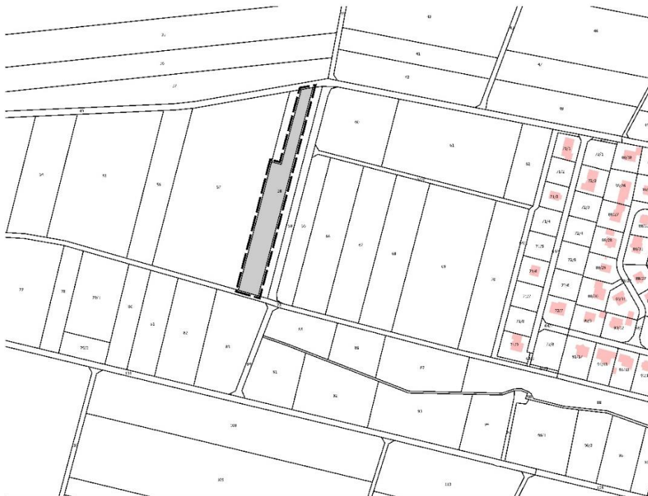
Externer Geltungsbereich Bebauungsplan Nr. 10, CEF-Maßnahme (ohne Maßstab)